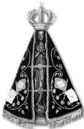
Nossa Senhora Aparecida, rogai por nós!