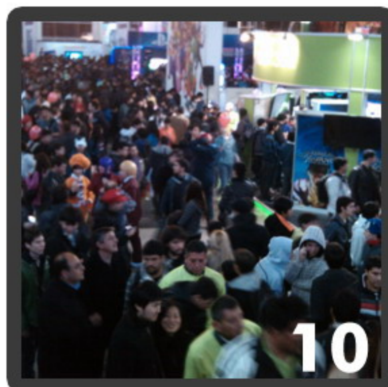
Desde Afuera Voz de Cosplayer ha vuelto