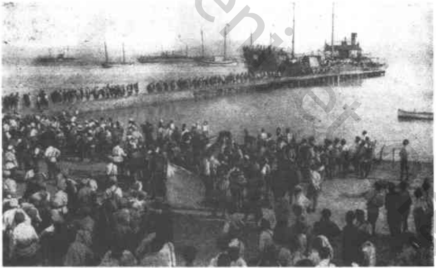
Res. 12 – İlk Suvari Birliğinin Sırbistana Hareketi