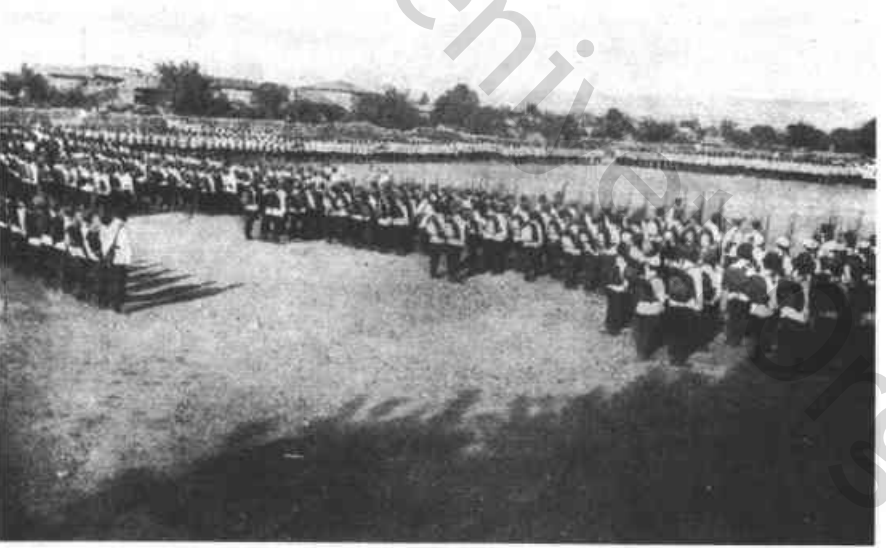
Res. 4 — Kentte Geçit Töreni