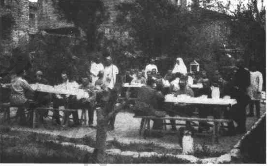
Res. 3 — Kentte beslenme merkezi