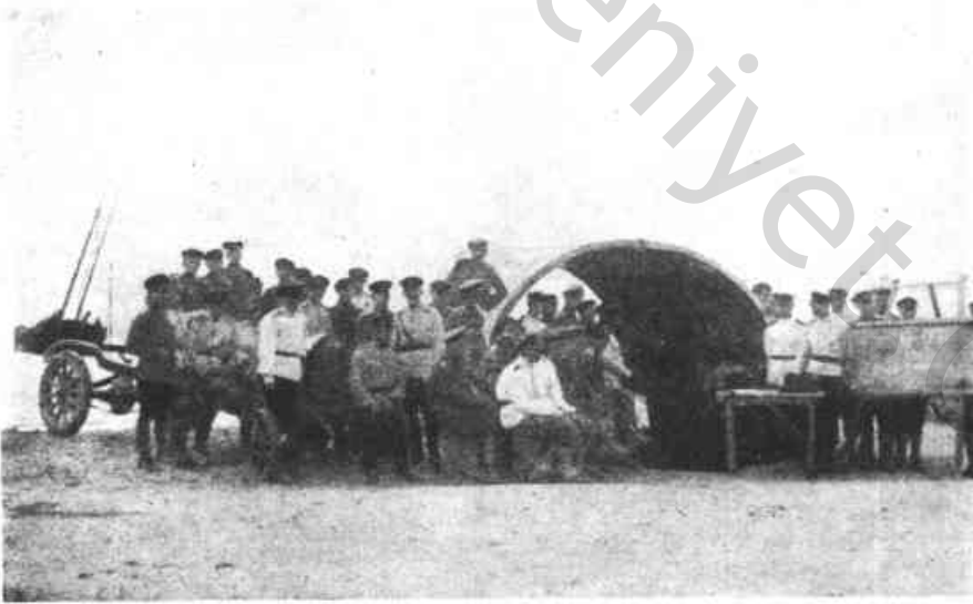
Res. 6 — Mühendislik Okulunda Ders