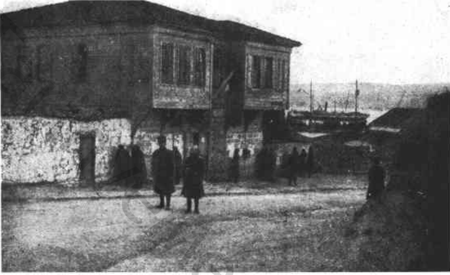
Res. 5 — Kolordu Karargâh Binası